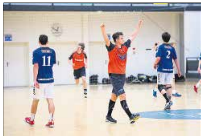
Der var klasseforskel i anden halvleg, hvor Århus kunne juble over at føringen blot blev større og større.