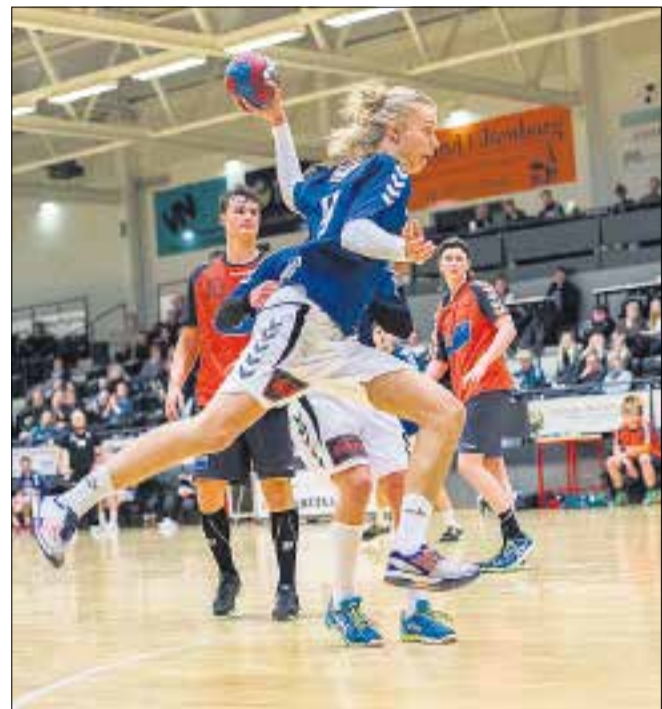
Der var godt besøgt i arenaen, men HF Mors' mange afbrændere betød, at spændingen sivede ud af kampen i anden halvleg.